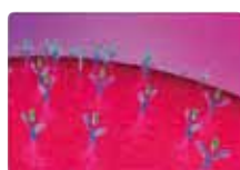
ターゲットがビーズ表面の抗体等に結合