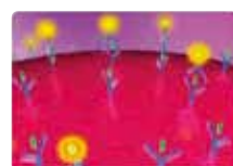
ビオチン化二次抗体等がターゲットに結合