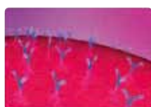
一次抗体やオリゴがビーズに結合 (通常のキットは既にこれらが結合しています)