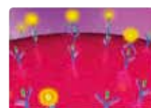
ビオチン化二次抗体等がターゲットに結合