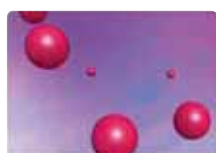
xMAP の 100 種類に色分けされたビーズ